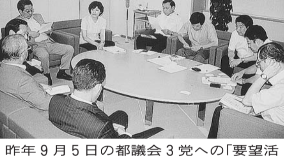
昨年9月5日の都議会3党への「要望活動」(上から自民党・民主党・公明党)