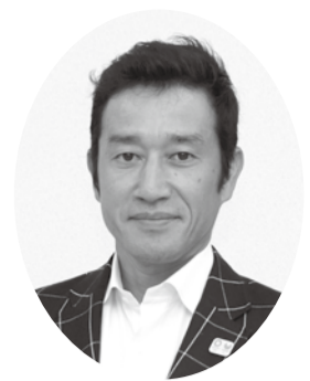
東京ビルメンテナンス政治連盟